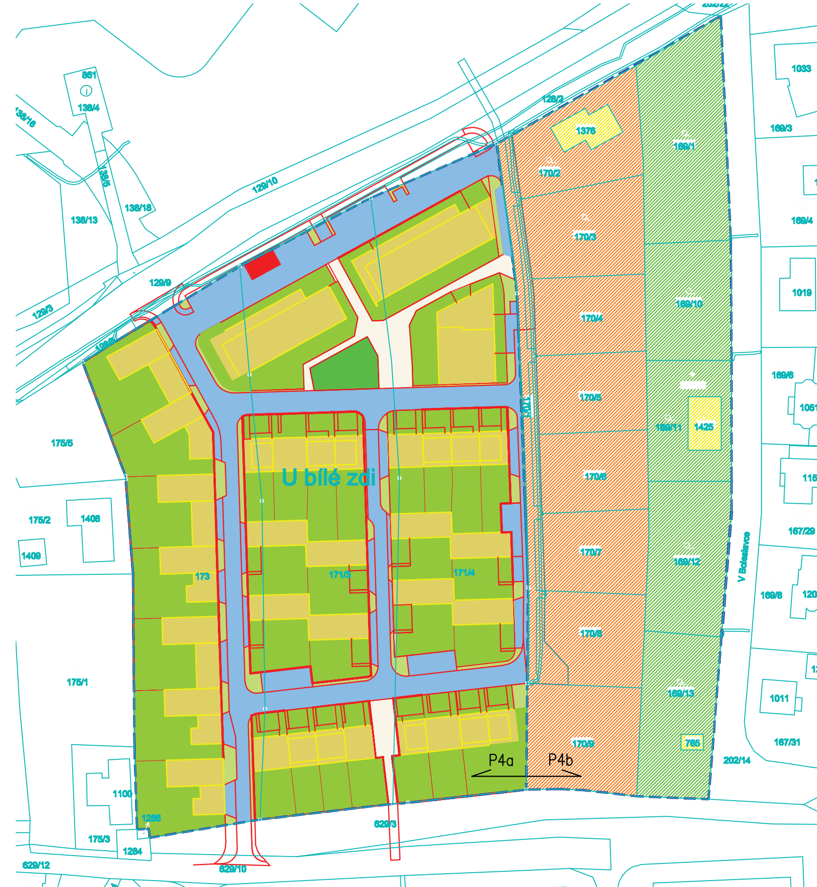
ZÁKRES VYNĚTÍ ZE ZPF 1:1000